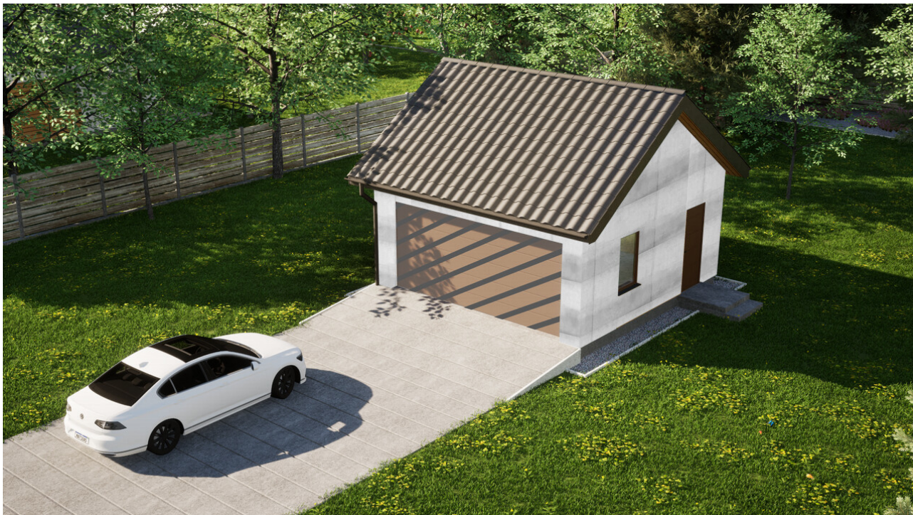
Garaż ERDOL G2 - Wersja prawa - Układ kalenicy równoległy z dachem dwuspadowym o kącie nachylenia 35 stopni - Bez bramy - Złoty dąb