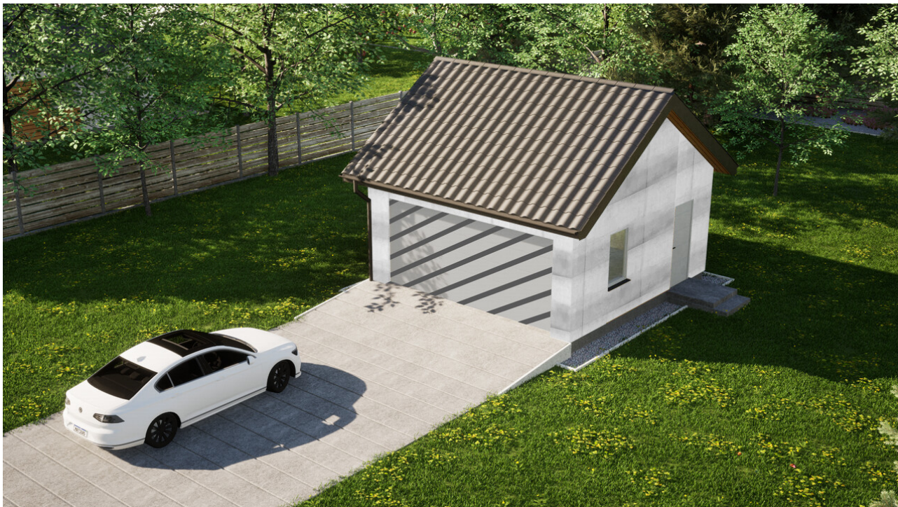
Garaz ERDOL G2 - Wersja prawa - Układ kalenicy równoległy z dachem dwuspadowym o kącie nachylenia 35 stopni - Bez bramy - Białe