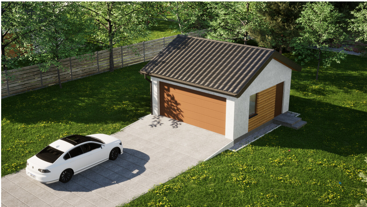
Garaż ERDOL G2 - Wersja prawa - Układ kalenicy równoległy z dachem dwuspadowym o kącie nachylenia 25 stopni - Brama segmentowa z napędem IO, sterowana pilotem - UniPro WIŚNIEWSKI - Złoty dąb