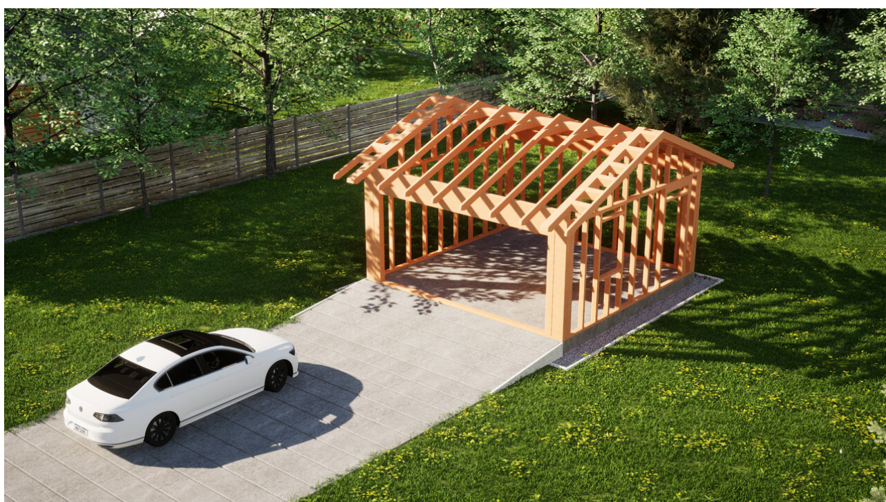
Widok konstrukcji: Garaz ERDOL G2 - Wersja prawa - Układ kalenicy równoległy z dachem dwuspadowym o kącie nachylenia 25 stopni

Przedstawiona oferta ma charakter informacyjny i nie stanowi oferty handlowej w rozumieniu Art. 66 par. 1 Kodeksu Cywilnego oraz innych przepisów prawnych. Zamieszczone wizualizacje mają charakter poglądowy i nie mogą być traktowane jako ostateczne projekty realizacyjne.