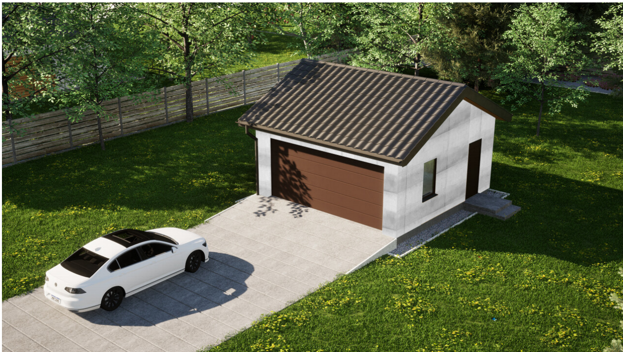
Garaz ERDOL G2 - Wersja prawa - Układ kalenicy równoległy z dachem dwuspadowym o kącie nachylenia 25 stopni - Brama segmentowa z napędem IO, sterowana pilotem - UniPro WIŚNIEWSKI - Orzech