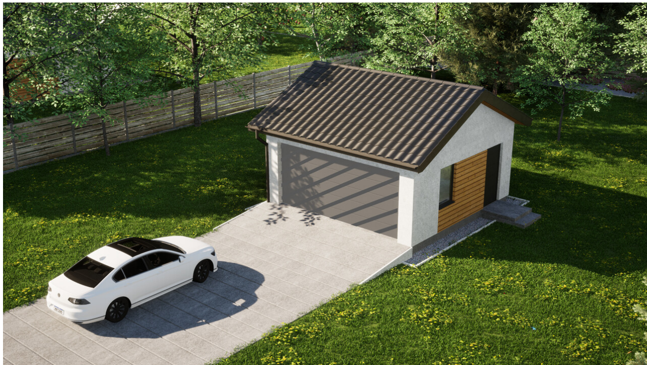
Garaz ERDOL G2 - Wersja prawa - Układ kalenicy równoległy z dachem dwuspadowym o kącie nachylenia 25 stopni - Bez bramy - Antracyt