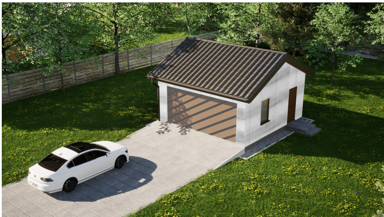
Garaz ERDOL G2 - Wersja prawa - Układ kalenicy równoległy z dachem dwuspadowym o kącie nachylenia 25 stopni - Bez bramy - Złoty dąb