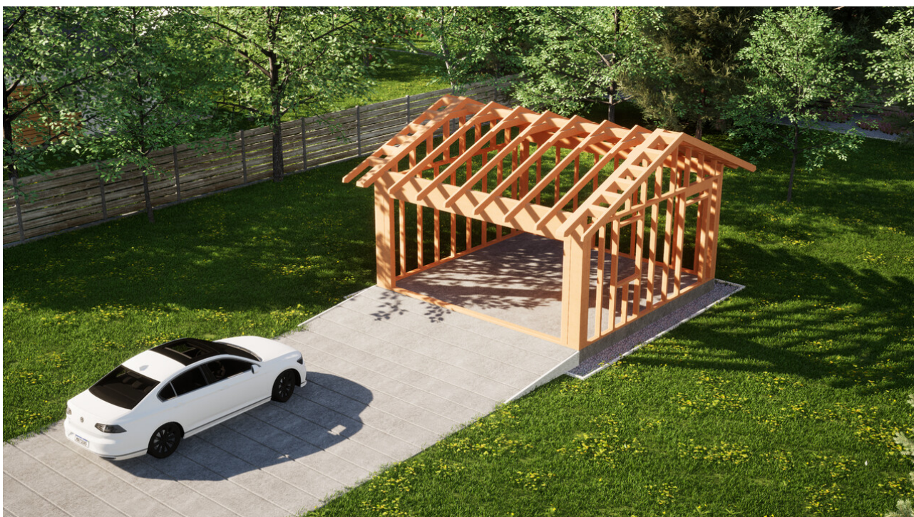
Widok konstrukcji: Garaz ERDOL G2 - Wersja prawa - Układ kalenicy równoległy z dachem dwuspadowym o kącie nachylenia 25 stopni

Przedstawiona oferta ma charakter informacyjny i nie stanowi oferty handlowej w rozumieniu Art. 66 par. 1 Kodeksu Cywilnego oraz innych przepisów prawnych. Zamieszczone wizualizacje mają charakter poglądowy i nie mogą być traktowane jako ostateczne projekty realizacyjne.