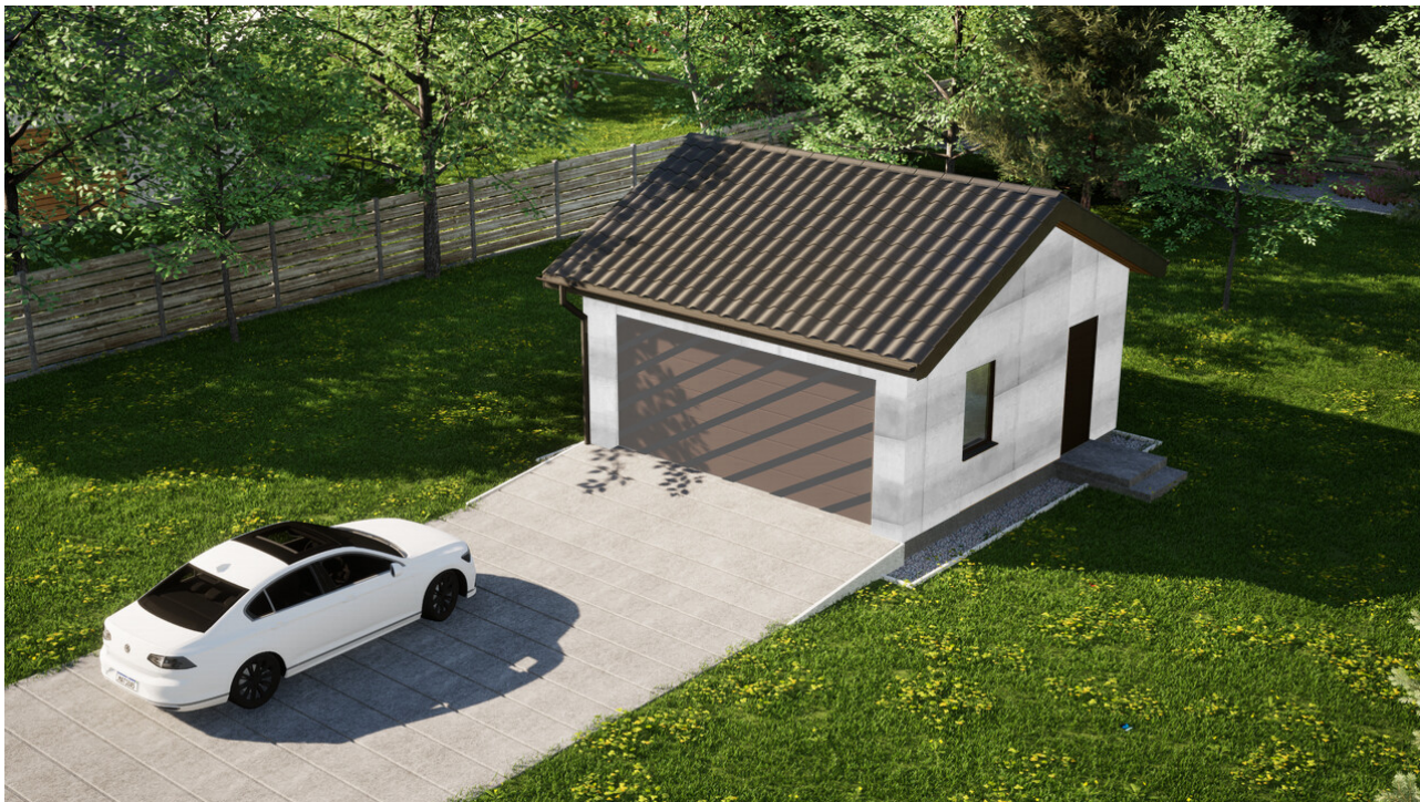
Garaz ERDOL G2 - Wersja prawa - Układ kalenicy równoległy z dachem dwuspadowym o kącie nachylenia 25 stopni - Bez bramy - Orzech