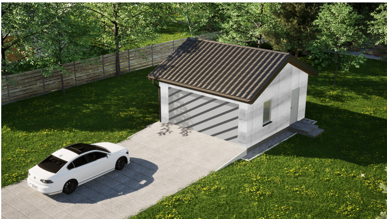
Garaz ERDOL G2 - Wersja prawa - Układ kalenicy równoległy z dachem dwuspadowym o kącie nachylenia 25 stopni - Bez bramy - Białe