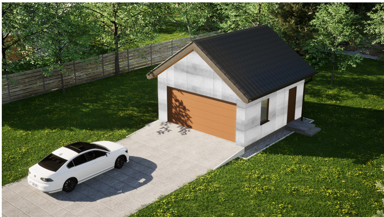
Garaż ERDOL G2 - Wersja prawa - Układ kalenicy prostopadły z dachem dwuspadowym o kącie nachylenia 35 stopni - Brama segmentowa z napędem IO, sterowana pilotem - UniPro WIŚNIEWSKI - Złoty dąb