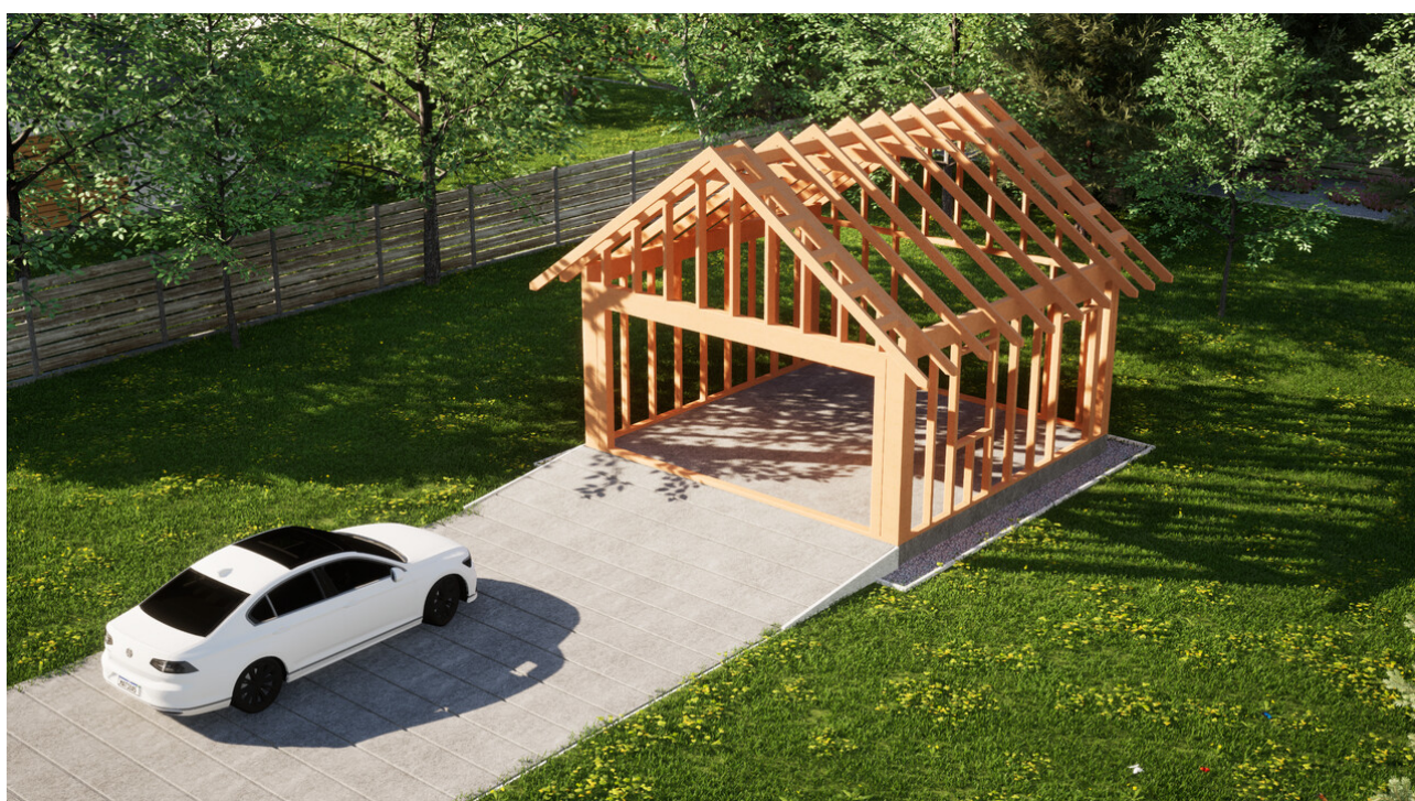
Widok konstrukcji: Garaz ERDOL G2 - Wersja prawa - Układ kalenicy prostopadły z dachem dwuspadowym o kącie nachylenia 35 stopni

Przedstawiona oferta ma charakter informacyjny i nie stanowi oferty handlowej w rozumieniu Art. 66 par. 1 Kodeksu Cywilnego oraz innych przepisów prawnych. Zamieszczone wizualizacje mają charakter poglądowy i nie mogą być traktowane jako ostateczne projekty realizacyjne.