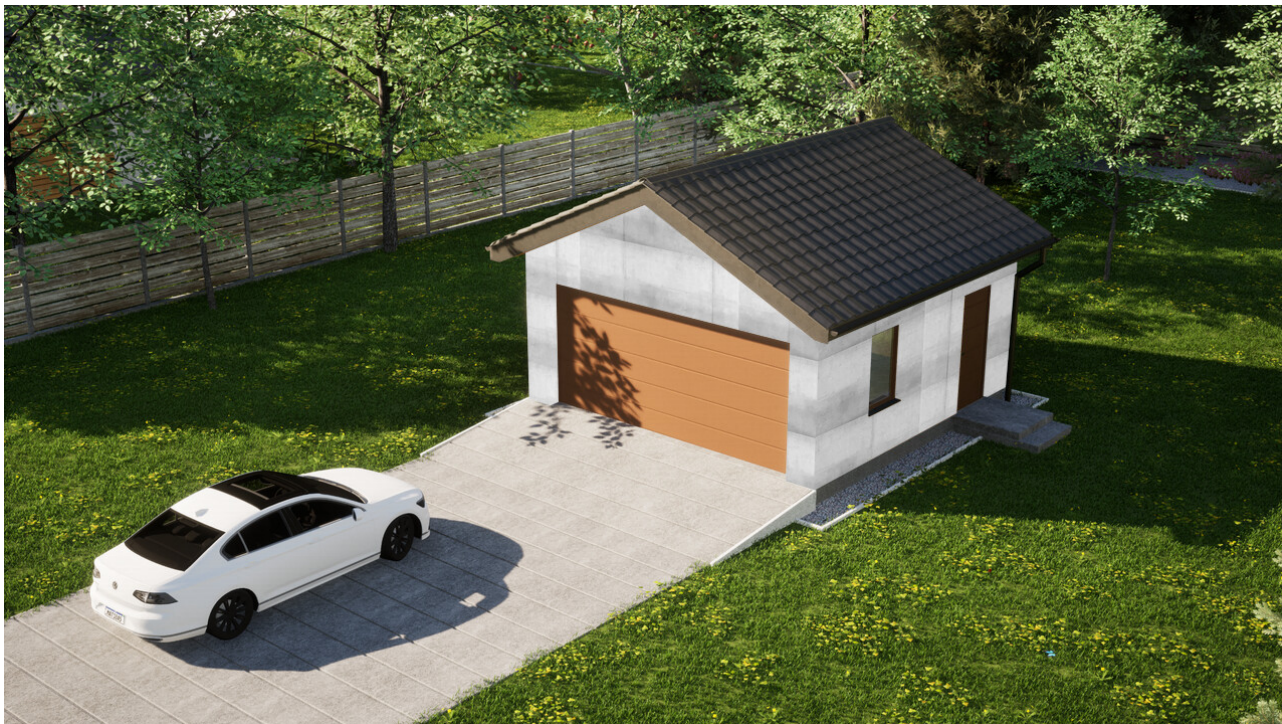
Garaż ERDOL G2 - Wersja prawa - Układ kalenicy prostopadły z dachem dwuspadowym o kącie nachylenia 25 stopni - Brama segmentowa z napędem IO, sterowana pilotem - UniPro WISNIEWSKI - Złoty dąb