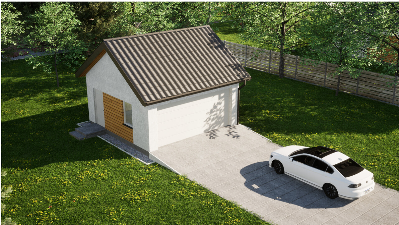
Garaż ERDOL G2 - Wersja lewa - Układ kalenicy równoległy z dachem dwuspadowym o kącie nachylenia 35 stopni - Brama segmentowa z napędem IO, sterowana pilotem - UniPro WISNIOWSKI - Białe