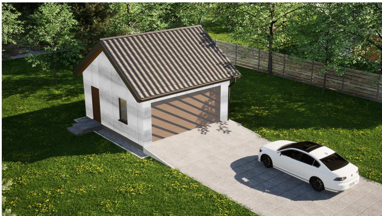
Garaż ERDOL G2 - Wersja lewa - Układ kalenicy równoległy z dachem dwuspadowym o kącie nachylenia 35 stopni - Bez bramy - Złoty dąb