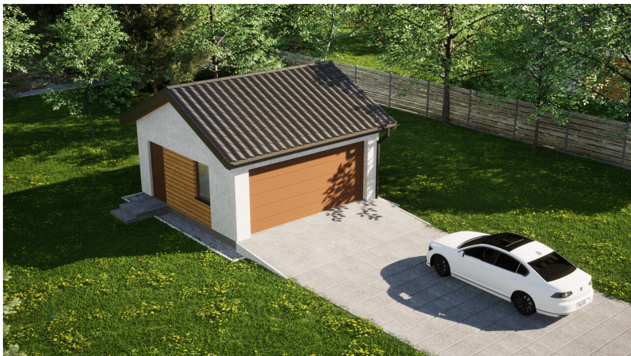
Garaż ERDOL G2 - Wersja lewa - Układ kalenicy równoległy z dachem dwuspadowym o kącie nachylenia 25 stopni - Brama segmentowa z napędem IO, sterowana pilotem - UniPro WIŚNIEWSKI - Złoty dąb