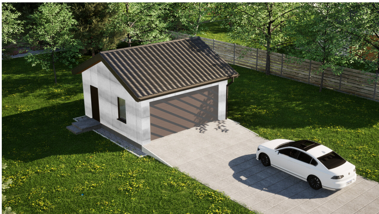
Garaż ERDOL G2 - Wersja lewa - Układ kalenicy równoległy z dachem dwuspadowym o kącie nachylenia 25 stopni - Bez bramy - Orzech