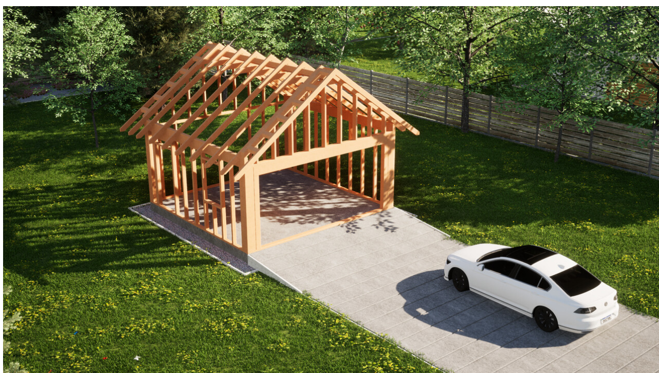
Widok konstrukcji: Garaz ERDOL G2 - Wersja lewa - Układ kalenicy prostopadły z dachem dwuspadowym o kącie nachylenia 35 stopni

Przedstawiona oferta ma charakter informacyjny i nie stanowi oferty handlowej w rozumieniu Art. 66 par. 1 Kodeksu Cywilnego oraz innych przepisów prawnych. Zamieszczone wizualizacje mają charakter poglądowy i nie mogą być traktowane jako ostateczne projekty realizacyjne.