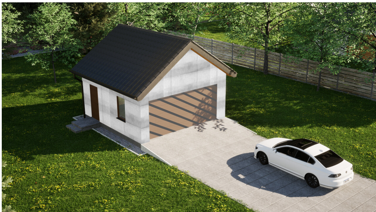
Garaz ERDOL G2 - Wersja lewa - Układ kalenicy prostopadły z dachem dwuspadowym o kącie nachylenia 35 stopni - Bez bramy - Złoty dąb