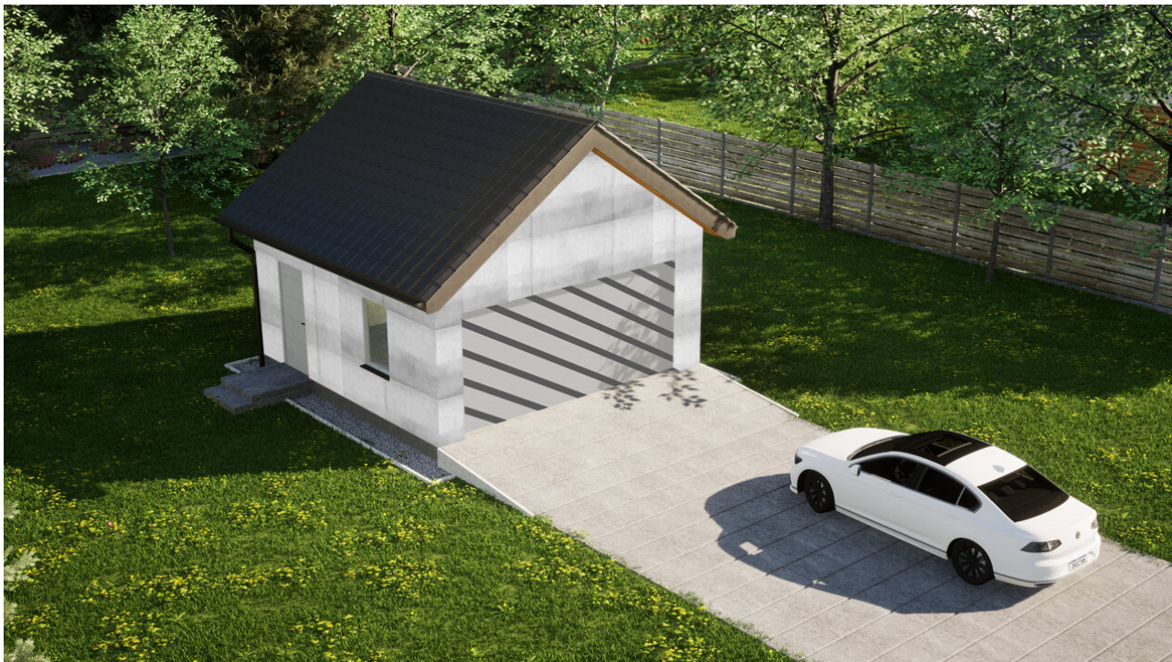
Garaz ERDOL G2 - Wersja lewa - Układ kalenicy prostopadły z dachem dwuspadowym o kącie nachylenia 35 stopni - Bez bramy - Białe