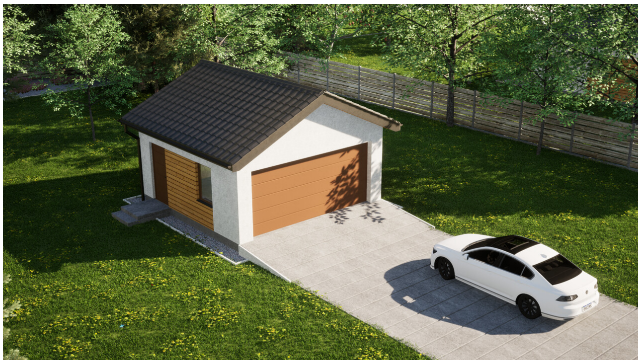
Garaz ERDOL G2 - Wersja lewa - Układ kalenicy prostopadły z dachem dwuspadowym o kącie nachylenia 25 stopni - Brama segmentowa z napędem IO, sterowana pilotem - UniPro WISNIEWSKI - Złoty dąb