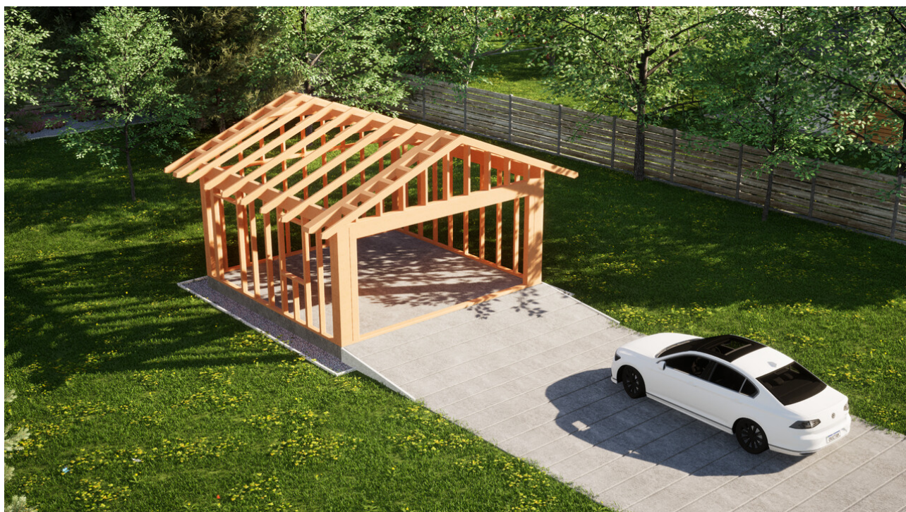
Widok konstrukcji: Garaz ERDOL G2 - Wersja lewa - Układ kalenicy prostopadły z dachem dwuspadowym o kącie nachylenia 25 stopni

Przedstawiona oferta ma charakter informacyjny i nie stanowi oferty handlowej w rozumieniu Art. 66 par. 1 Kodeksu Cywilnego oraz innych przepisów prawnych. Zamieszczone wizualizacje mają charakter poglądowy i nie mogą być traktowane jako ostateczne projekty realizacyjne.