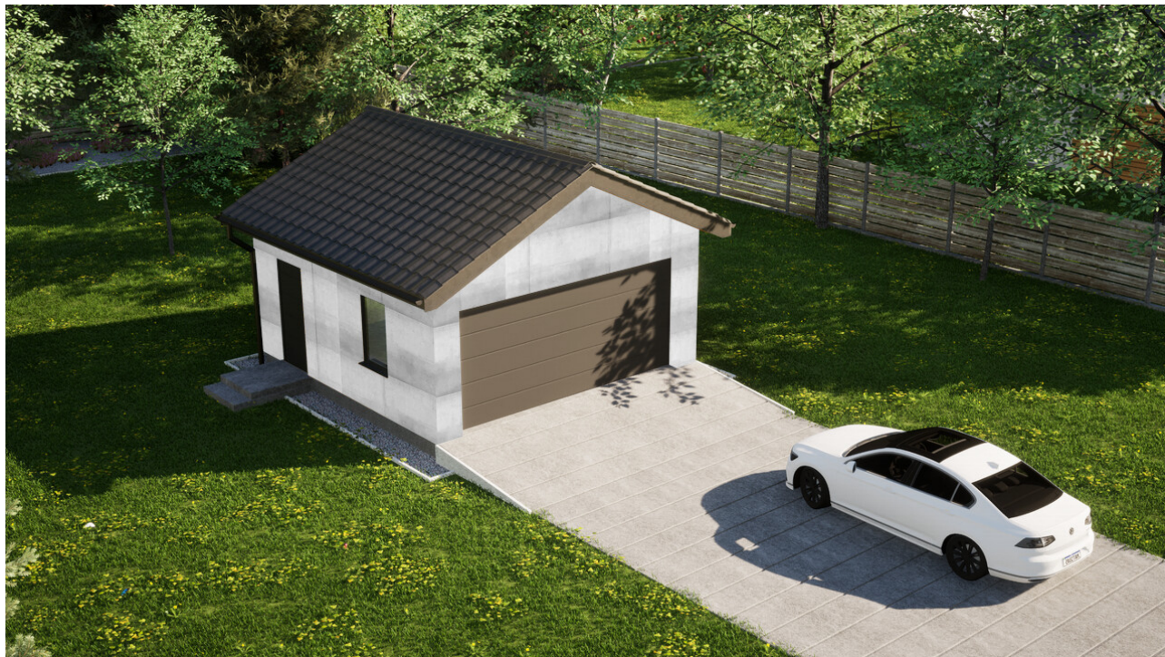
Garaz ERDOL G2 - Wersja lewa - Układ kalenicy prostopadły z dachem dwuspadowym o kącie nachylenia 25 stopni - Brama segmentowa z napędem IO, sterowana pilotem - UniPro WISNIOWSKI - Antracyt