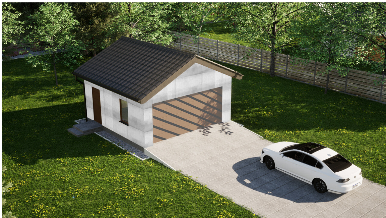
Garaz ERDOL G2 - Wersja lewa - Układ kalenicy prostopadły z dachem dwuspadowym o kącie nachylenia 25 stopni - Bez bramy - Złoty dąb