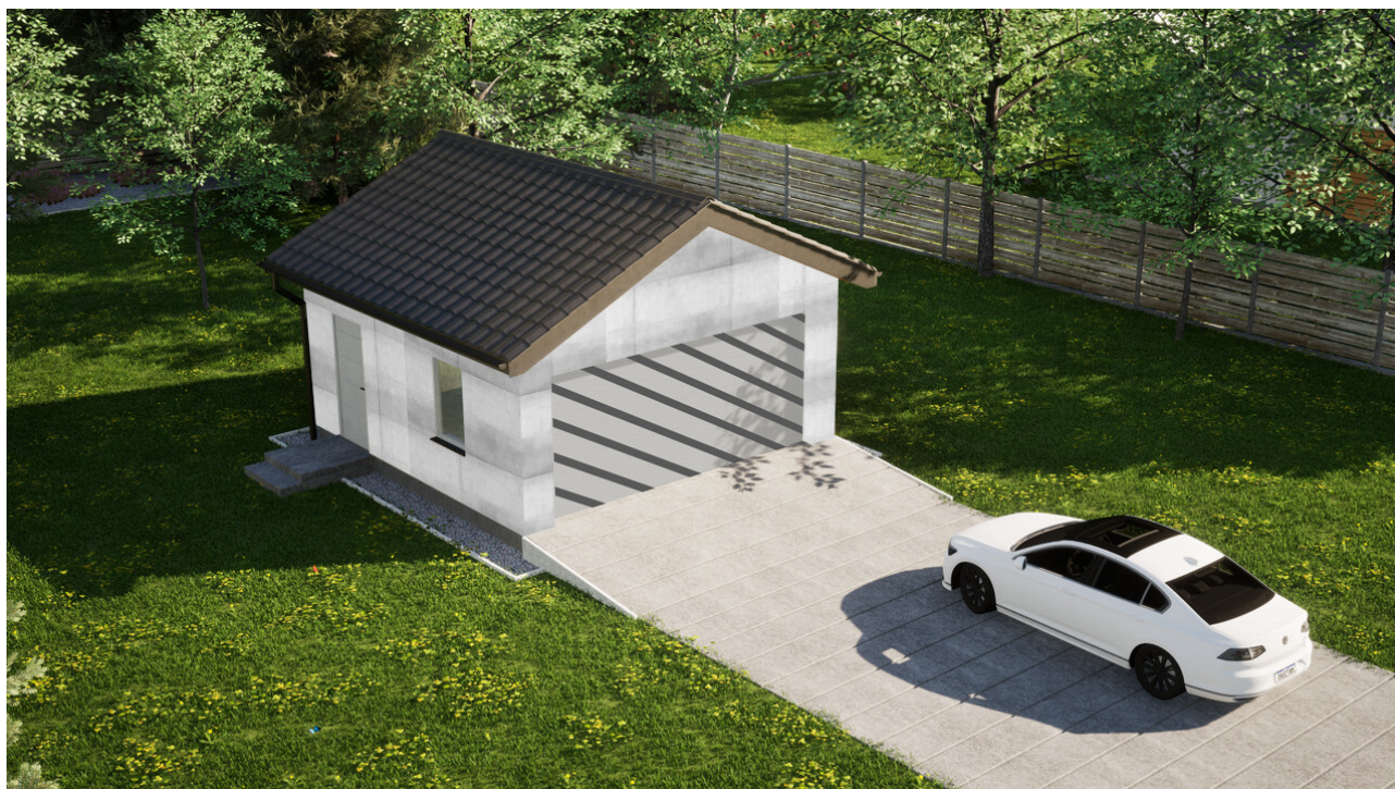
Garaz ERDOL G2 - Wersja lewa - Układ kalenicy prostopadły z dachem dwuspadowym o kącie nachylenia 25 stopni - Bez bramy - Białe