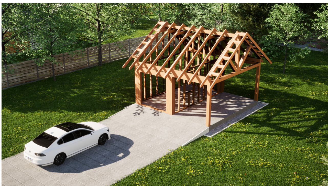
Widok konstrukcji: Garaż ERDOL G1W - Wersja prawa - Układ kalenicy równoległy z dachem dwuspadowym o kącie nachylenia 35 stopni