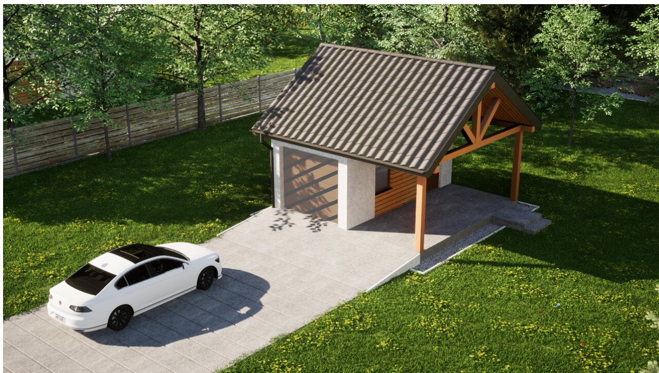
Garaż ERDOL G1W - Wersja prawa - Układ kalenicy równoległy z dachem dwuspadowym o kącie nachylenia 35 stopni - Bez bramy - Żółty dąb