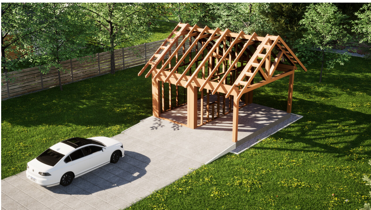
Widok konstrukcji: Garaz ERDOL G1W - Wersja prawa - Układ kalenicy równoległy z dachem dwuspadowym o kącie nachylenia 35 stopni