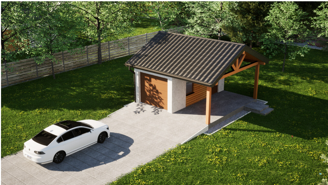
Garaz ERDOL G1W - Wersja prawa - Układ kalenicy równoległy z dachem dwuspadowym o kącie nachylenia 25 stopni - Brama segmentowa z napędem IO, sterowana pilotem - UniPro WIŚNIEWSKI - Złoty dąb