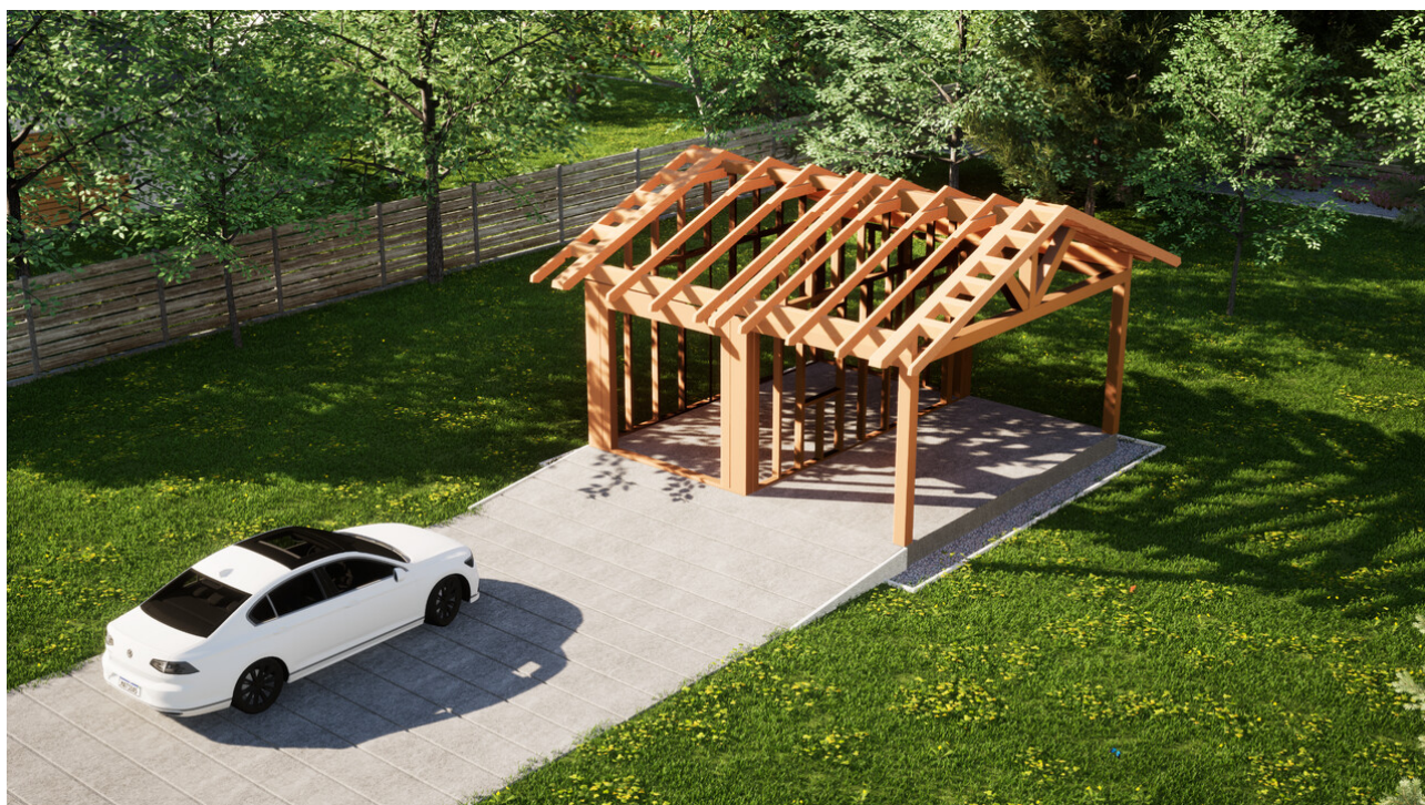
Widok konstrukcji: Garaz ERDOL G1W - Wersja prawa - Układ kalenicy równoległy z dachem dwuspadowym o kącie nachylenia 25 stopni