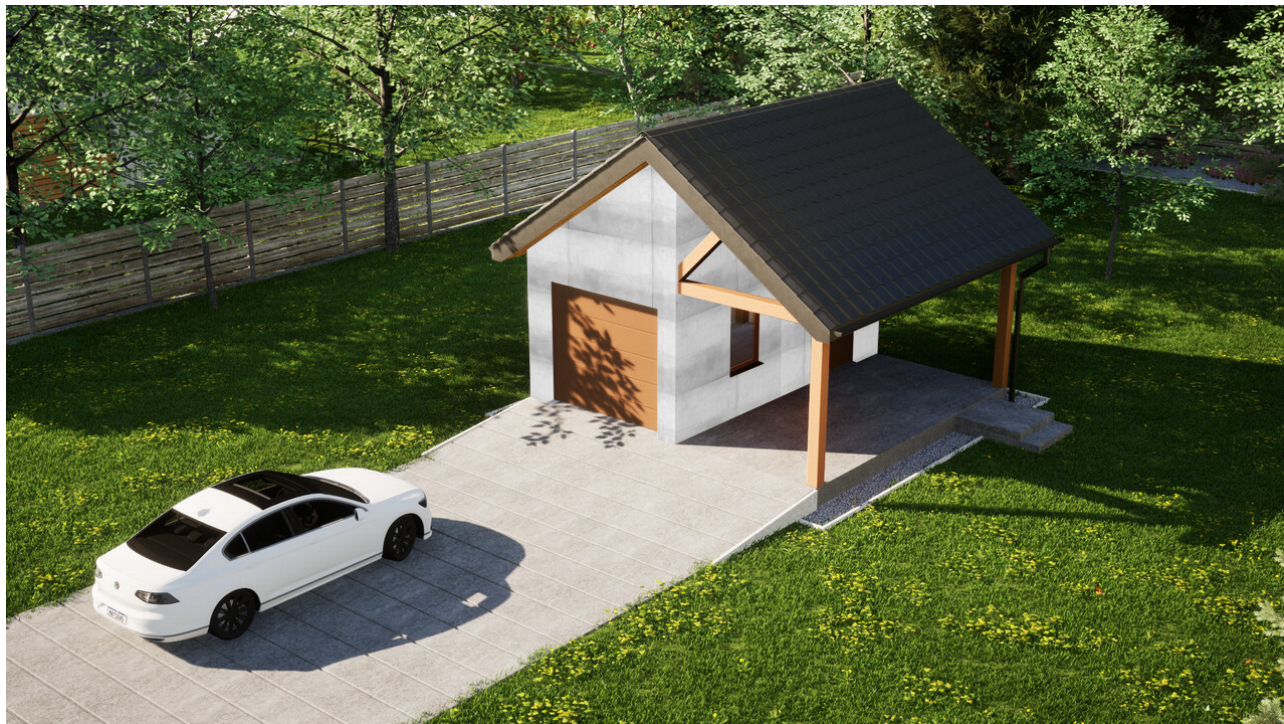
Garaz ERDOL G1W - Wersja prawa - Układ kalenicy prostopadły z dachem dwuspadowym o kącie nachylenia 35 stopni - Brama segmentowa z napędem IO, sterowana pilotem - UniPro WIŚNIEWSKI - Żłoty dąb