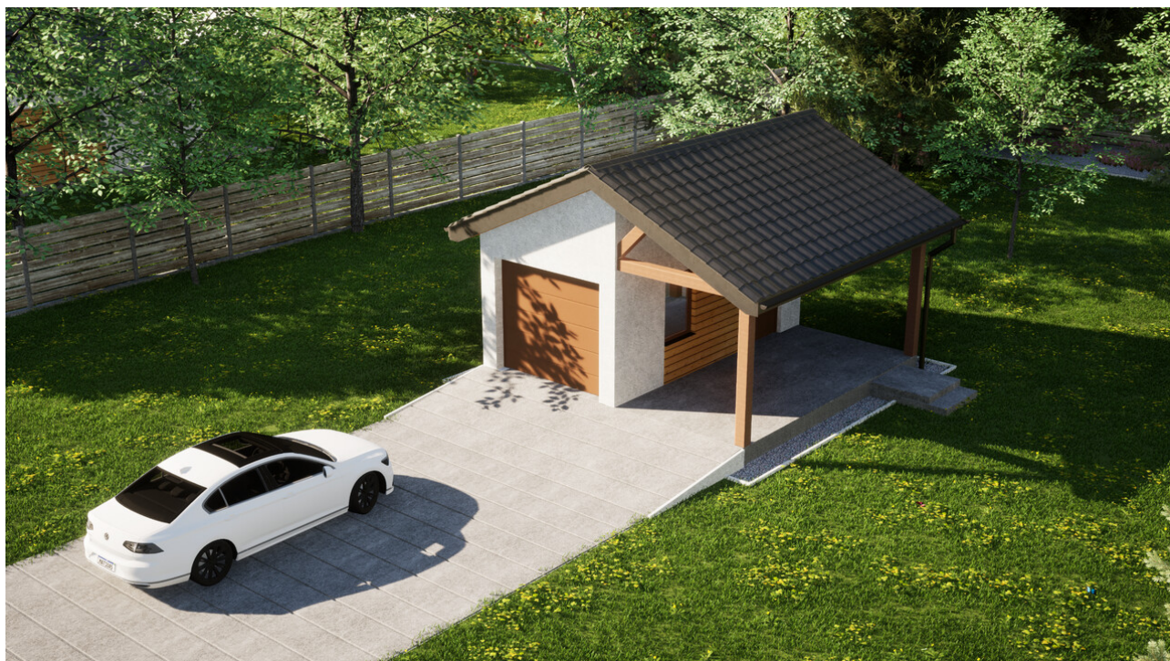
Garaż ERDOL G1W - Wersja prawa - Układ kalenicy prostopadły z dachem dwuspadowym o kącie nachylenia 25 stopni - Brama segmentowa z napędem IO, sterowana pilotem - UniPro WIŚNIEWSKI - Żłoty dąb