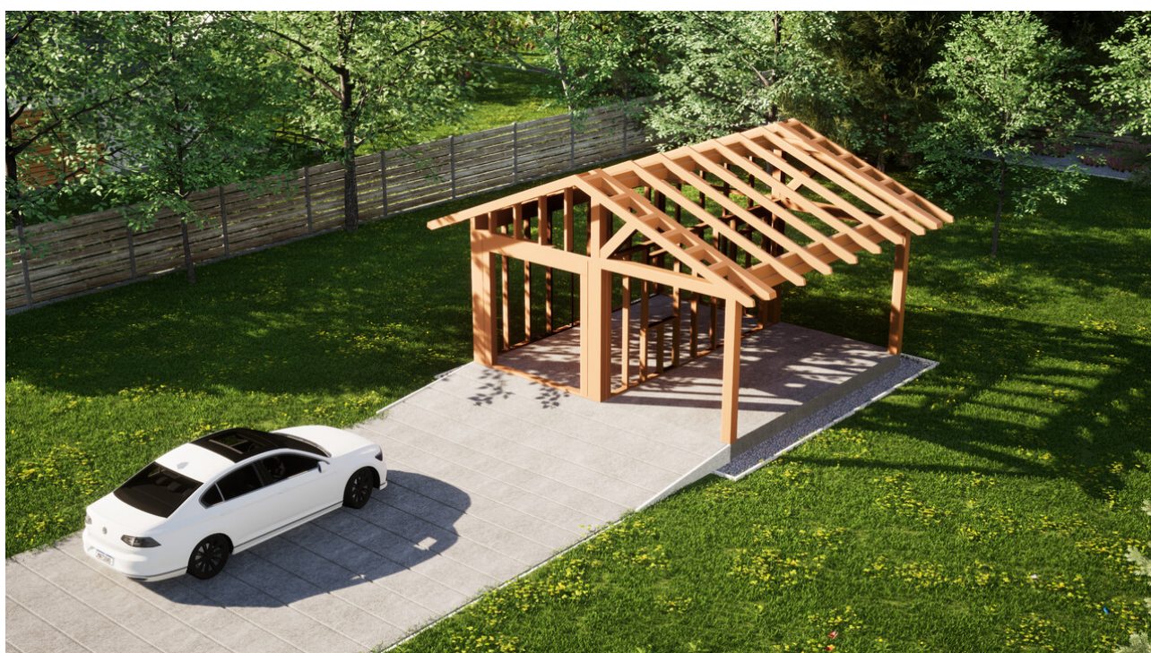
Widok konstrukcji: Garaz ERDOL G1W - Wersja prawa - Układ kalenicy prostopadły z dachem dwuspadowym o kącie nachylenia 25 stopni