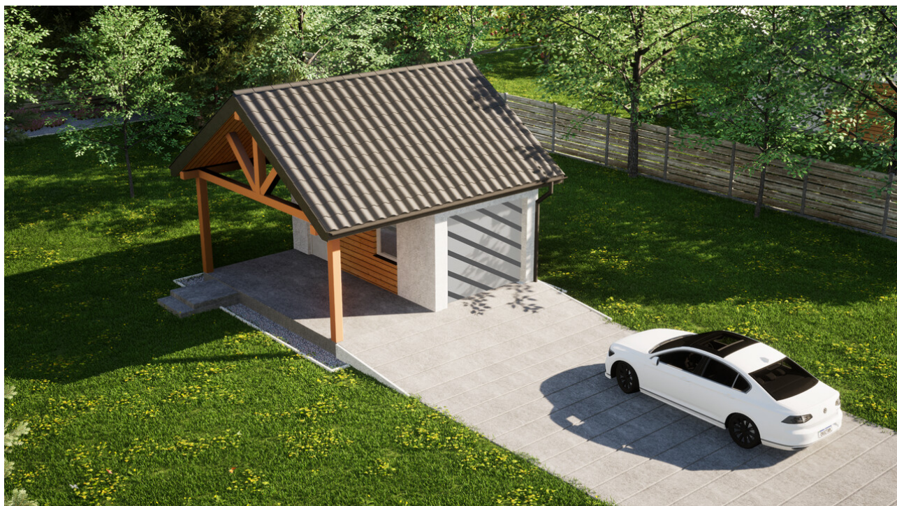
Garaz ERDOL G1W - Wersja lewa - Układ kalenicy równoległy z dachem dwuspadowym o kącie nachylenia 35 stopni - Bez bramy - Białe