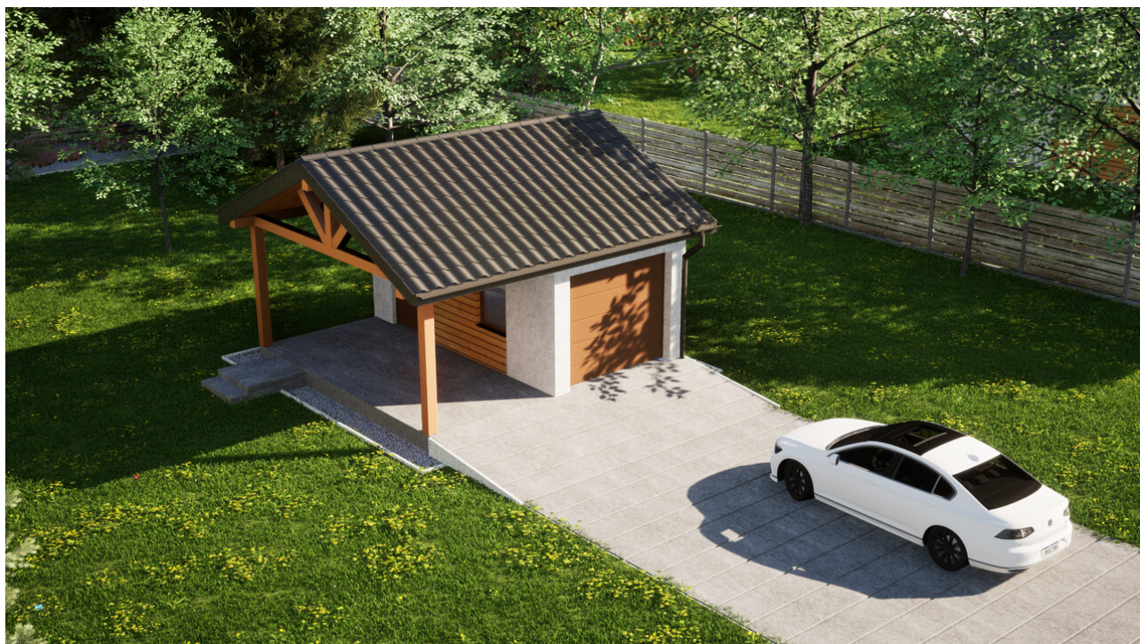
Garaz ERDOL G1W - Wersja lewa - Układ kalenicy równoległy z dachem dwuspadowym o kącie nachylenia 25 stopni - Brama segmentowa z napędem IO, sterowana pilotem - UniPro WISNIEWSKI - Złoty dąb