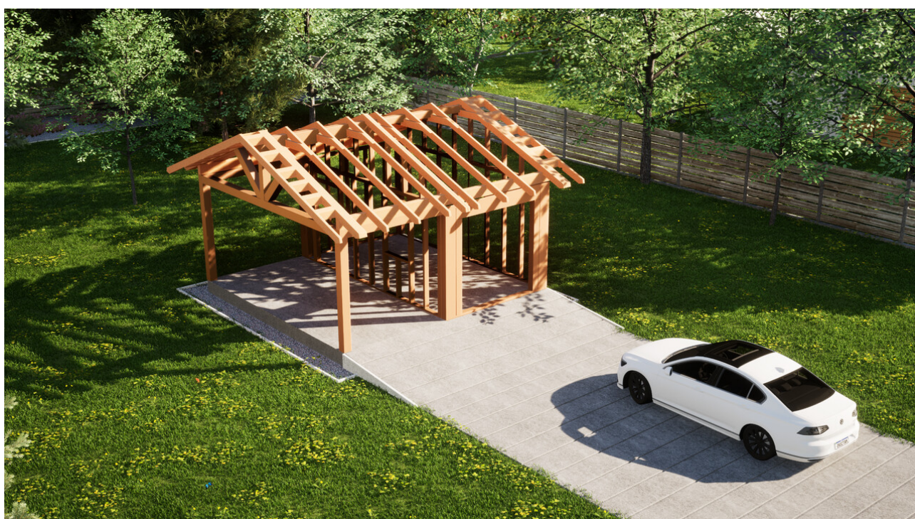
Widok konstrukcji: Garaz ERDOL G1W - Wersja lewa - Układ kalenicy równoległy z dachem dwuspadowym o kącie nachylenia 25 stopni