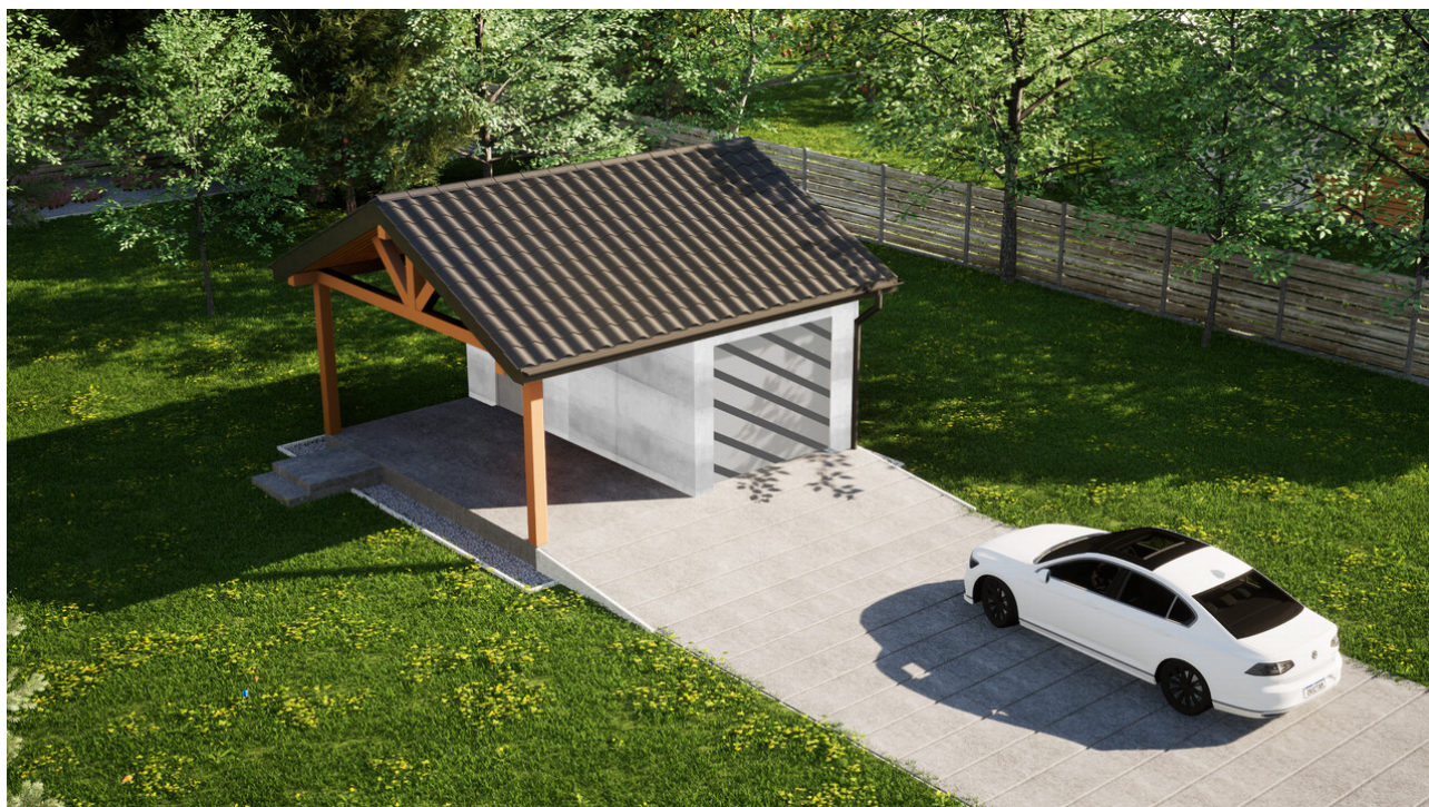
Garaz ERDOL G1W - Wersja lewa - Układ kalenicy równoległy z dachem dwuspadowym o kącie nachylenia 25 stopni - Bez bramy - Białe