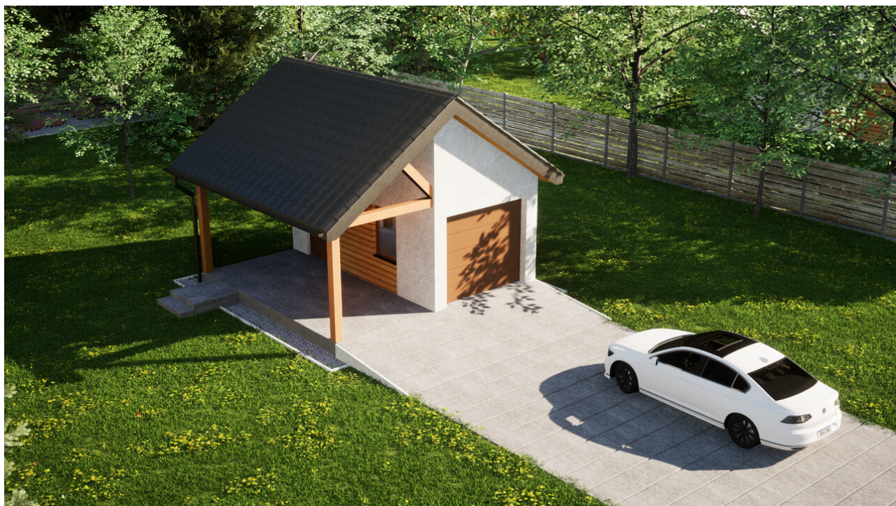
Garaż ERDOL G1W - Wersja lewa - Układ kalenicy prostopadły z dachem dwuspadowym o kącie nachylenia 35 stopni - Brama segmentowa z napędem IO, sterowana pilotem - UniPro WISNIEWSKI - Złoty dąb