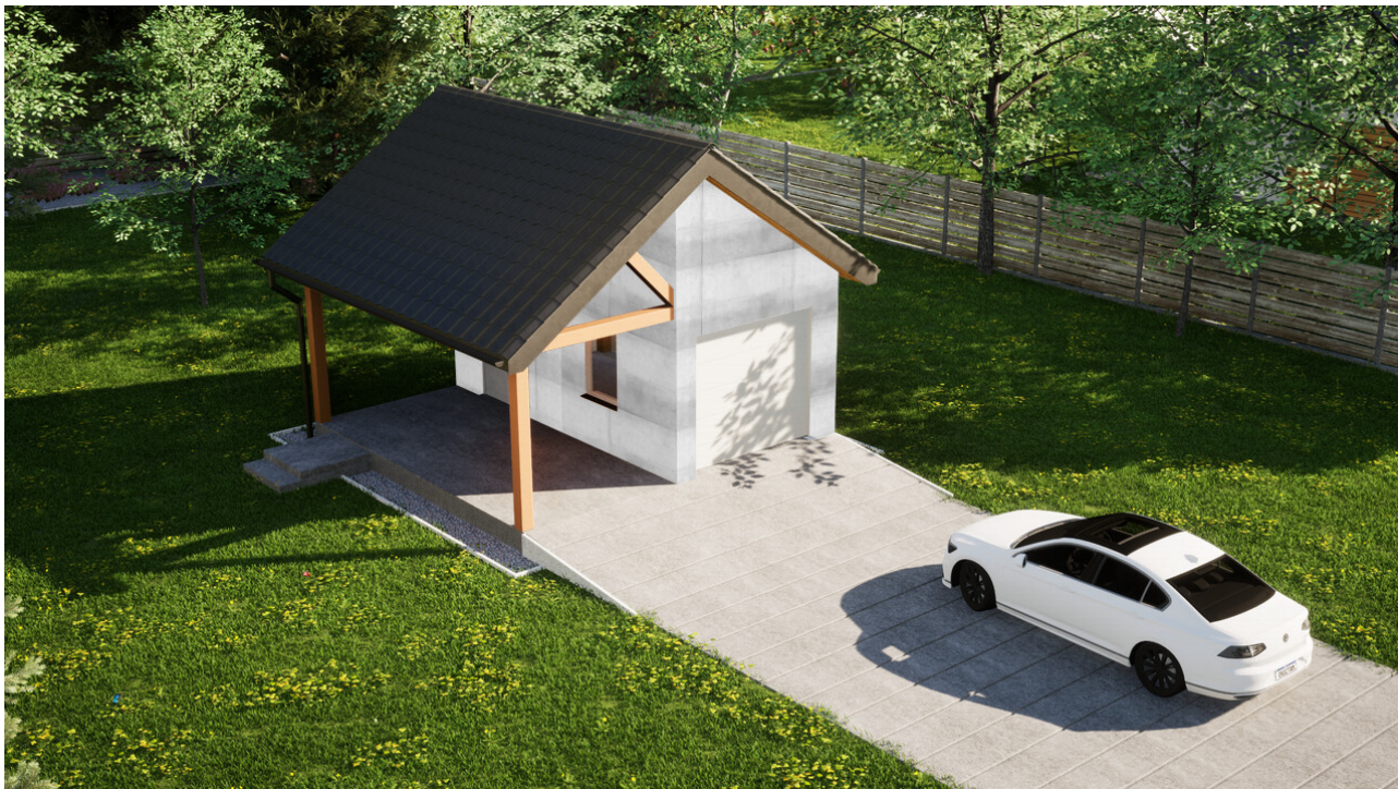
Garaz ERDOL G1W - Wersja lewa - Układ kalenicy prostopadły z dachem dwuspadowym o kącie nachylenia 35 stopni - Brama segmentowa z napędem IO, sterowana pilotem - UniPro WIŚNIOWSKI - Białe