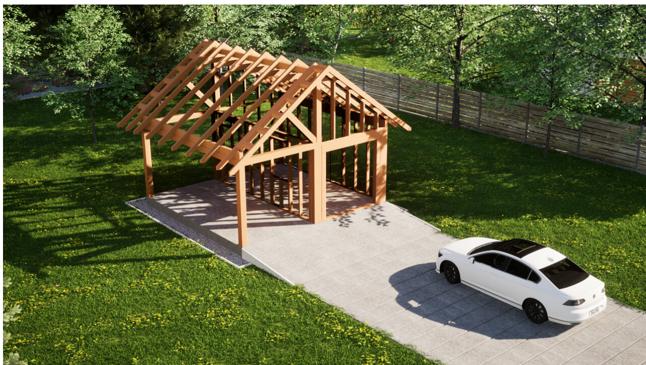
Widok konstrukcji: Garaz ERDOL G1W - Wersja lewa - Układ kalenicy prostopadły z dachem dwuspadowym o kącie nachylenia 35 stopni

Przedstawiona oferta ma charakter informacyjny i nie stanowi oferty handlowej w rozumieniu Art. 66 par. 1 Kodeksu Cywilnego oraz innych przepisów prawnych. Zamieszczone wizualizacje mają charakter poglądowy i nie mogą być traktowane jako ostateczne projekty realizacyjne.