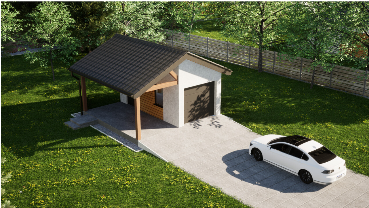
Garaż ERDOL G1W - Wersja lewa - Układ kalenicy prostopadły z dachem dwuspadowym o kącie nachylenia 25 stopni - Brama segmentowa z napędem IO, sterowana pilotem - UniPro WIŚNIEWSKI - Antracyt