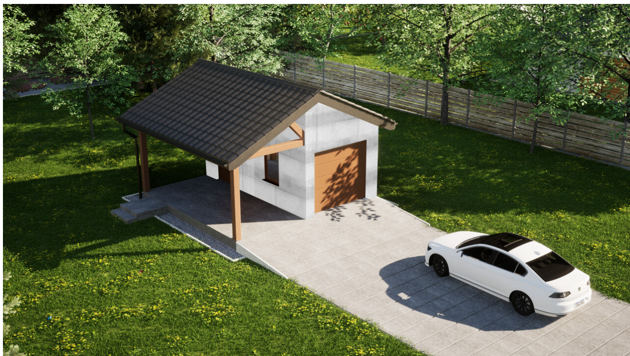
Garaż ERDOL G1W - Wersja lewa - Układ kalenicy prostopadły z dachem dwuspadowym o kącie nachylenia 25 stopni - Brama segmentowa z napędem IO, sterowana pilotem - UniPro WISNIEWSKI - Złoty dąb