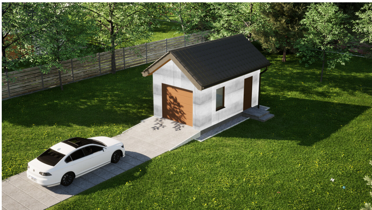
Garaż ERDOL G1 - Wersja prawa - Układ kalenicy prostopadły z dachem dwuspadowym o kącie nachylenia 35 stopni - Brama segmentowa z napędem IO, sterowana pilotem - UniPro WIŚNIEWSKI - Złoty dąb