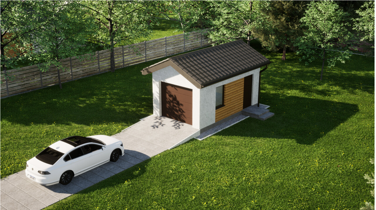
Garaż ERDOL G1 - Wersja prawa - Układ kalenicy prostopadły z dachem dwuspadowym o kącie nachylenia 25 stopni - Brama segmentowa z napędem IO, sterowana pilotem - UniPro WIŚNIEWSKI - Orzech