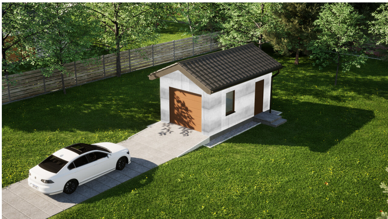
Garaż ERDOL G1 - Wersja prawa - Układ kalenicy prostopadły z dachem dwuspadowym o kącie nachylenia 25 stopni - Brama segmentowa z napędem IO, sterowana pilotem - UniPro WISNIEWSKI - Złoty dąb