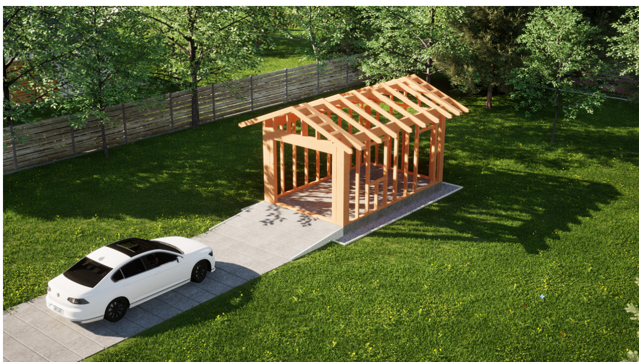
Widok konstrukcji: Garaz ERDOL G1 - Wersja prawa - Układ kalenicy prostopadły z dachem dwuspadowym o kącie nachylenia 25 stopni

Przedstawiona oferta ma charakter informacyjny i nie stanowi oferty handlowej w rozumieniu Art. 66 par. 1 Kodeksu Cywilnego oraz innych przepisów prawnych. Zamieszczone wizualizacje mają charakter poglądowy i nie mogą być traktowane jako ostateczne projekty realizacyjne.