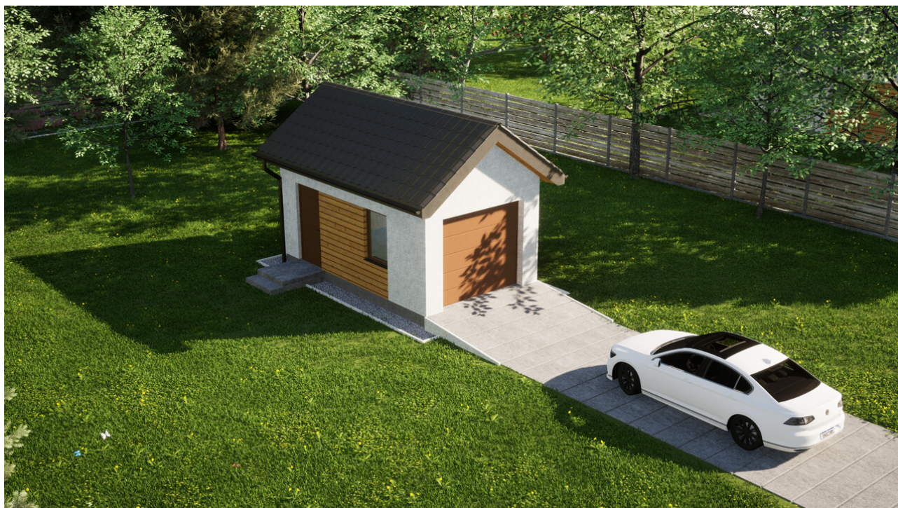
Garaz ERDOL G1 - Wersja lewa - Układ kalenicy prostokątny z dachem dwuspadowym o kącie nachylenia 35 stopni - Brama segmentowa z napędem IO, sterowana pilotem - UniPro WISNIEWSKI - Złoty dąb