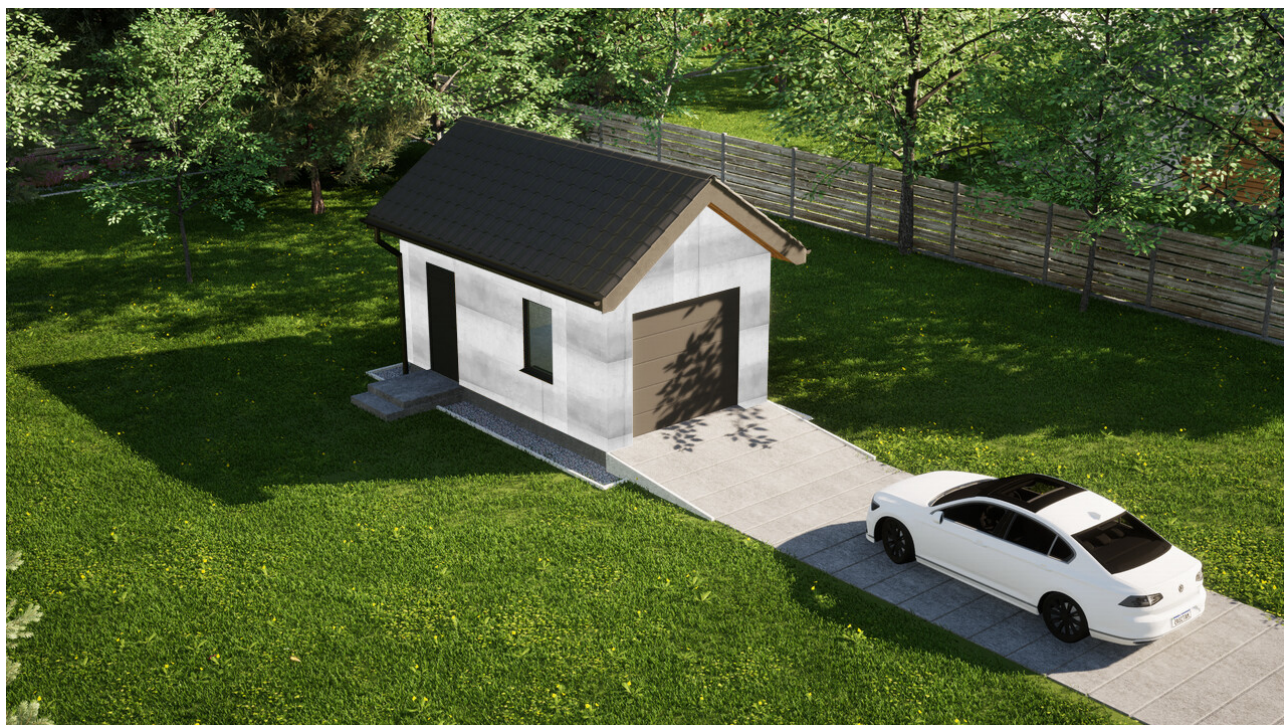
Garaz ERDOL G1 - Wersja lewa - Układ kalenicy prostopadły z dachem dwuspadowym o kącie nachylenia 35 stopni - Brama segmentowa z napędem IO, sterowana pilotem - UniPro WIŚNIEWSKI - Antracyt