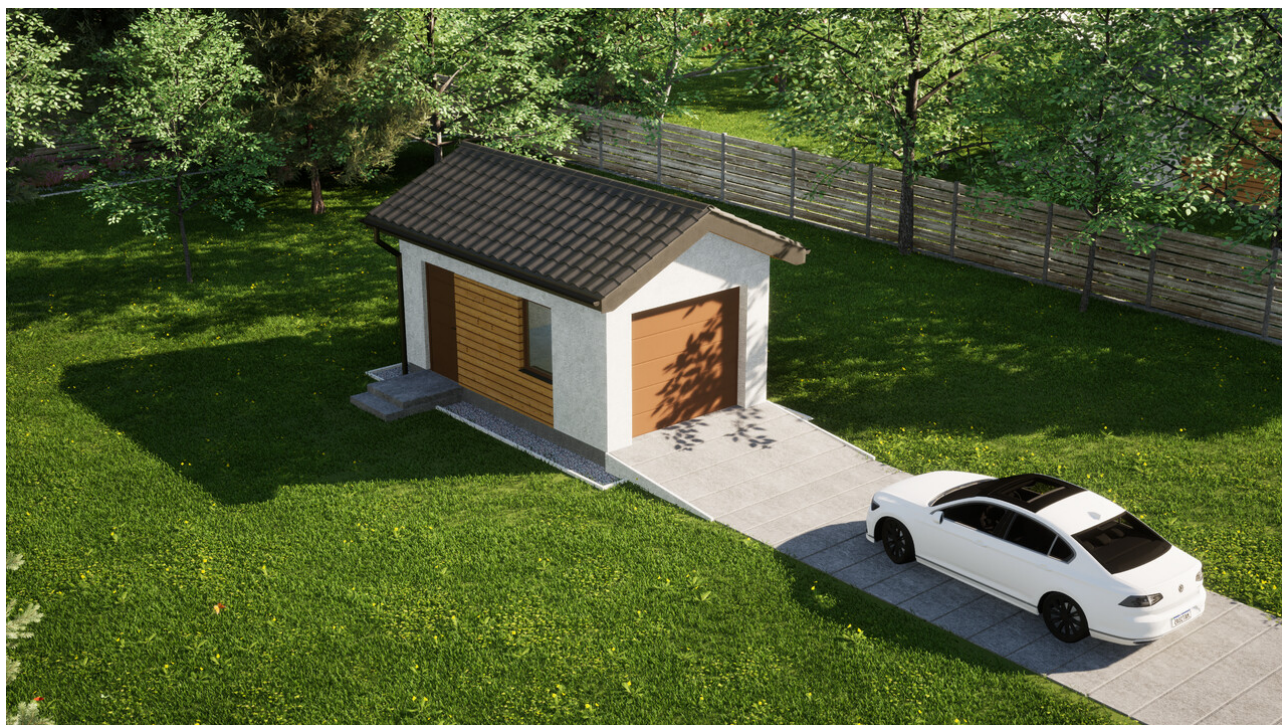
Garaz ERDOL G1 - Wersja lewa - Układ kalenicy prostopadły z dachem dwuspadowym o kącie nachylenia 25 stopni - Brama segmentowa z napędem IO, sterowana pilotem - UniPro WISNIEWSKI - Złoty dąb