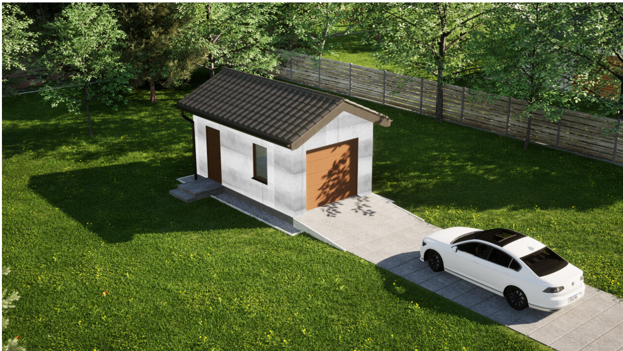
Garaz ERDOL G1 - Wersja lewa - Układ kalenicy prostopadły z dachem dwuspadowym o kącie nachylenia 25 stopni - Brama segmentowa z napędem IO, sterowana pilotem - UniPro WISNIEWSKI - Złoty dąb