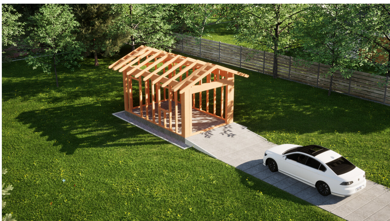
Widok konstrukcji: Garaz ERDOL G1 - Wersja lewa - Układ kalenicy prostopadły z dachem dwuspadowym o kącie nachylenia 25 stopni

Przedstawiona oferta ma charakter informacyjny i nie stanowi oferty handlowej w rozumieniu Art. 66 par. 1 Kodeksu Cywilnego oraz innych przepisów prawnych. Zamieszczone wizualizacje mają charakter poglądowy i nie mogą być traktowane jako ostateczne projekty realizacyjne.