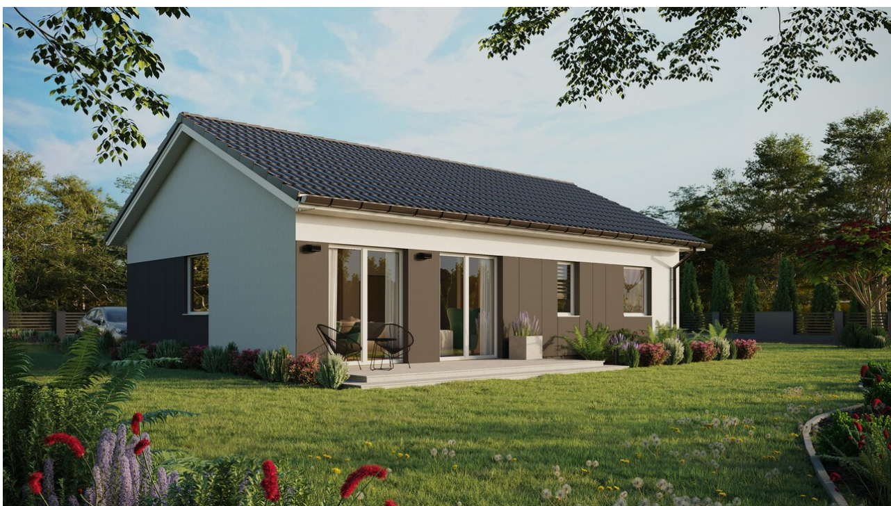
Projekt ERDOL 2 XL - Wersja prawa (salon po prawej stronie) - Dwuspadowy bez poddasza użytkowego - kąt nachylenia 25 stopni - Świetlik dachowy - Okna standardowe - Styropian, siatka i klej - Białe - Bez instalacji fotowoltaicznej