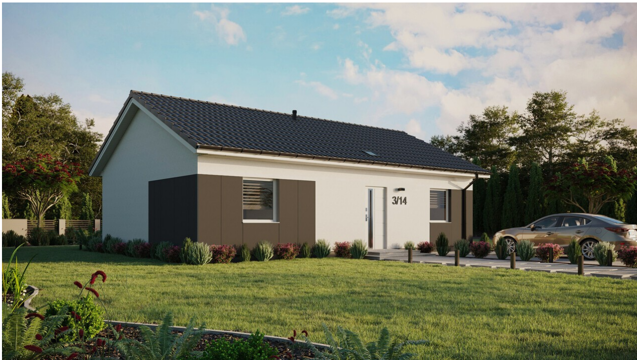
Projekt ERDOL 2 XL - Wersja prawa (salon po prawej stronie) - Dwuspadowy bez poddasza użytkowego - kąt nachylenia 25 stopni - Świetlik dachowy - Okna standardowe - Styropian, siatka i klej - Białe - Bez instalacji fotowoltaicznej