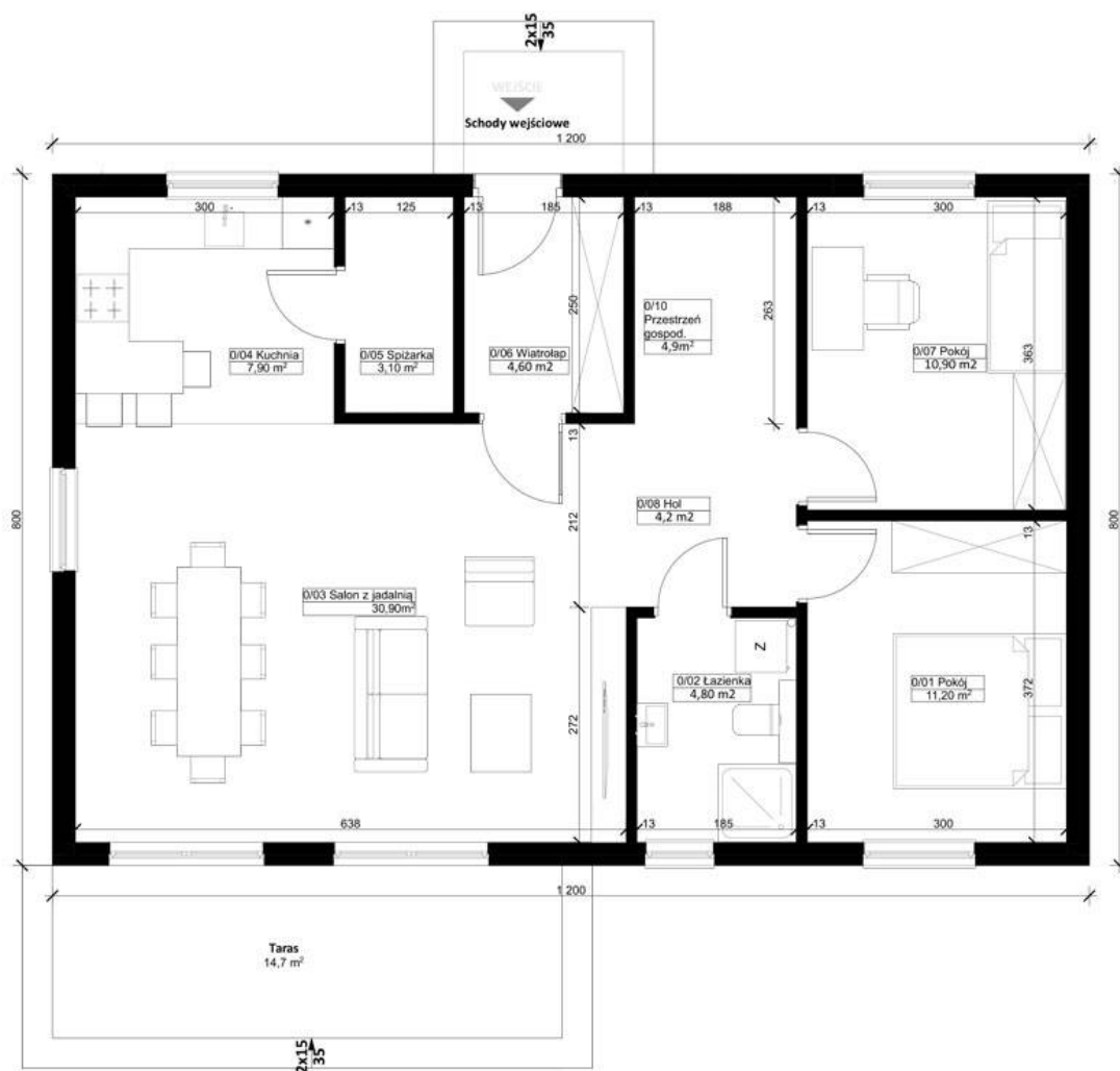
Projekt ERDOL 2 XL - Wersja prawa (salon po prawej stronie) - Rzut parteru